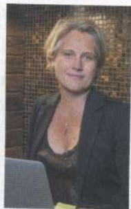
L'Ecorce Concept Store Courchevel 1650

Chaque projet est sur-mesure, permettant de concrétiser un rêve. Je n'impose rien, je ne suis qu'un fil conducteur. Les idées naissent du partage et mes clients ont confiance en moi. C'est ce qui me laisse libre pour créer : la liberté et la confiance sont partenaires.